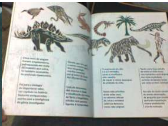
Partes do livro utilizadas