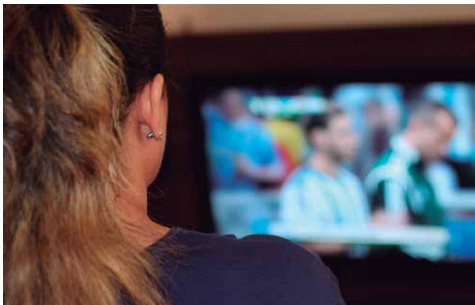
Figura 3: Exemplo de lazer passivo