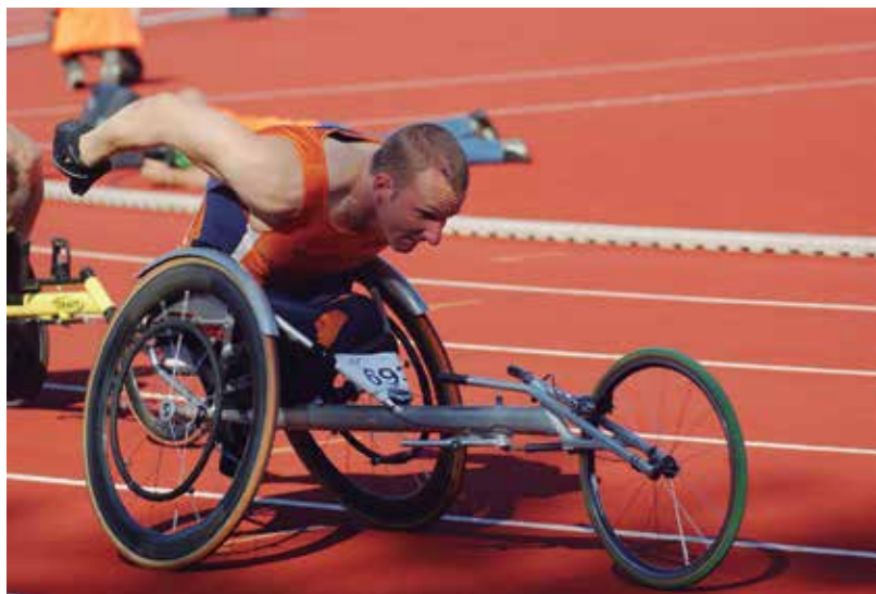
Figura 5: Esporte para portador de necessidades especiais

Muito se fala hoje sobre acessibilidade, mas você sabe o que é? Acessibilidade é a pessoa poder usufruir de todos os benefícios na sociedade; é um direito constitucional que deve proporcionar o acesso dos cidadãos aos espaços e serviços que uma cidade venha a oferecer. Porém, aos espaços públicos de lazer, principalmente, os portadores de necessidades especiais não têm acesso. É dever do Estado financiar políticas públicas que modifiquem essa realidade e proporcionem espaços apropriados para o lazer de pessoas com necessidades especiais. Os espaços devem se adequar, devem ser modificados e reestruturados para receber de forma adequada também este grupo.