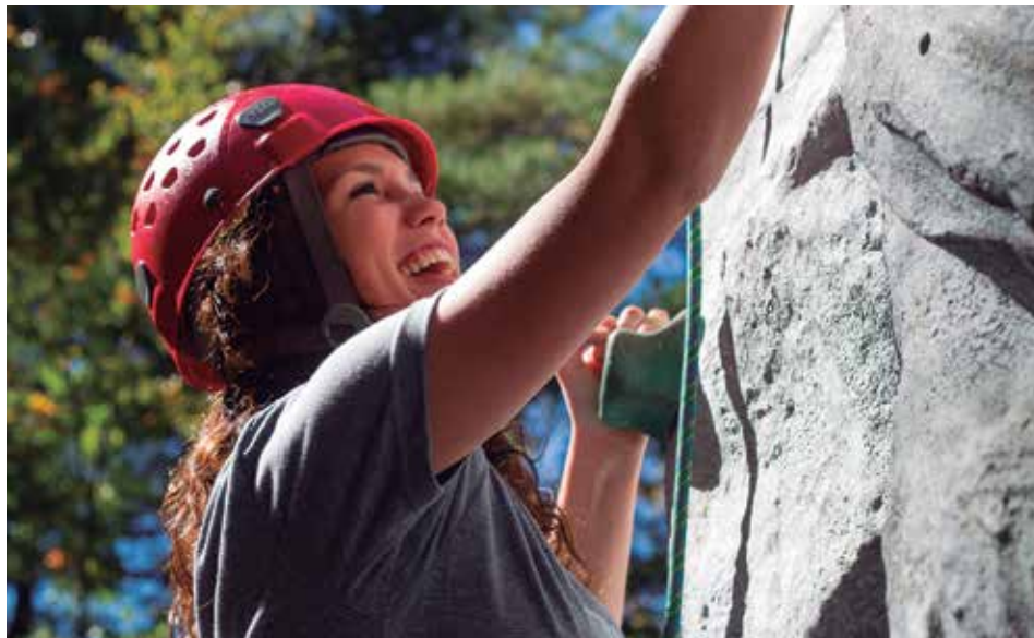
Figura 2: Escalada como exemplo de lazer

O pensamento de que o lazer é algo mais do que tempo livre vem de filósofos gregos, como Aristóteles e Platão. A ideia grega de lazer era baseada em um tempo para si, era um estado ou uma condição, sem estar preocupado com nenhuma ocupação. Com a Revolução Industrial e o passar dos anos, veio a diminuição da jornada de trabalho e, conseqüentemente, o aumento do tempo livre. Lazer tornou-se significado de um período de tempo livre de trabalho, disponível para qualquer atividade - o que abriu as portas para uma nova indústria, a do lazer. Este novo e crescente mercado avançou rápido e, inicialmente, os setores que mais conseguiram vantagens foram os vendedores de bebidas alcoólicas, o futebol e as corridas, todas as atividades que entusiasmavam a massa trabalhadora nas horas livres. Mas... e hoje? O que se entende por lazer?