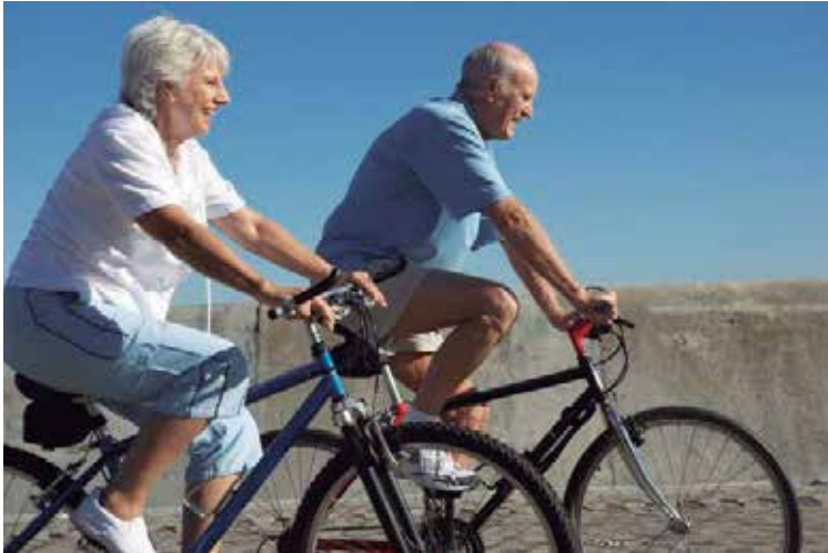
Figura 4: Exemplo de lazer ativo