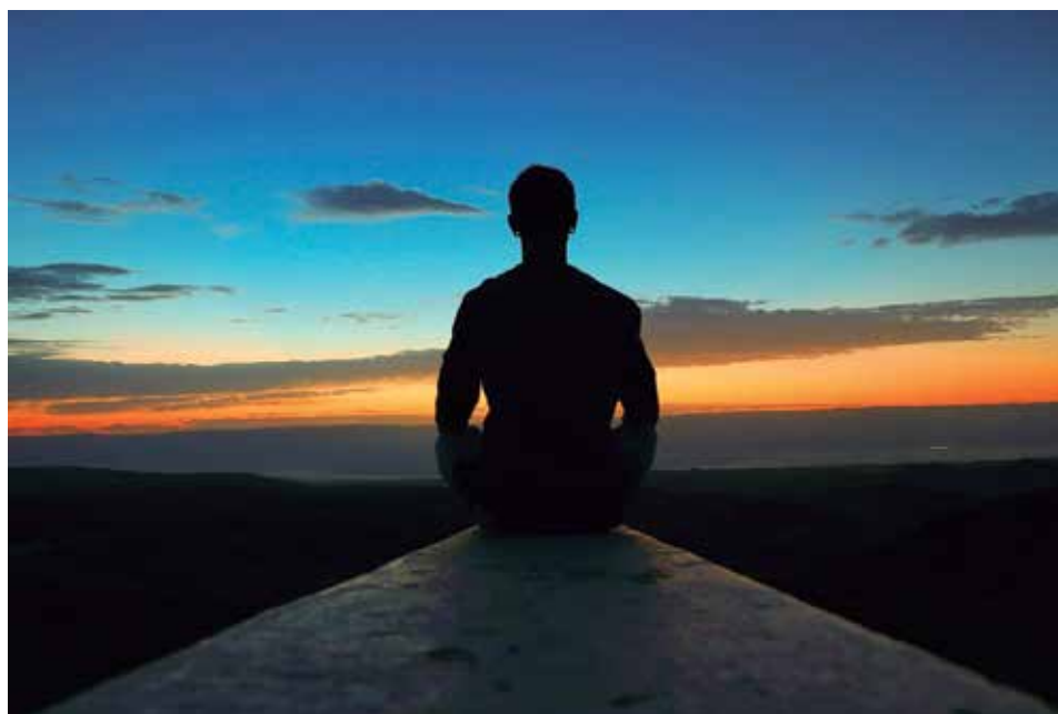
Figura 1: A qualidade de vida envolve diversos fatores que fazem parte de nossas vidas e, dentre eles, a saúde é o principal, e está relacionada com o bem-estar físico, social e mental.

O discurso veiculado pela mídia sobre saúde está impregnado pelo padrão de beleza vigente. A busca pelo corpo magro, por algumas pessoas, e pelo corpo forte, por outras, movimenta um grande mercado que promete tornar os corpos de seus consumidores iguais ao dos modelos que anunciam seus produtos. Esse é o chamado mercado do corpo, onde cosméticos, academias e clínicas anunciam saúde, qualidade de vida e o corpo que você deseja... Você já deve ter notado que, na televisão e na internet, por exemplo, sempre aparecem homens e mulheres perfeitos que, de forma implícita ou declarada, criticam aqueles que estão fora dos padrões de beleza.