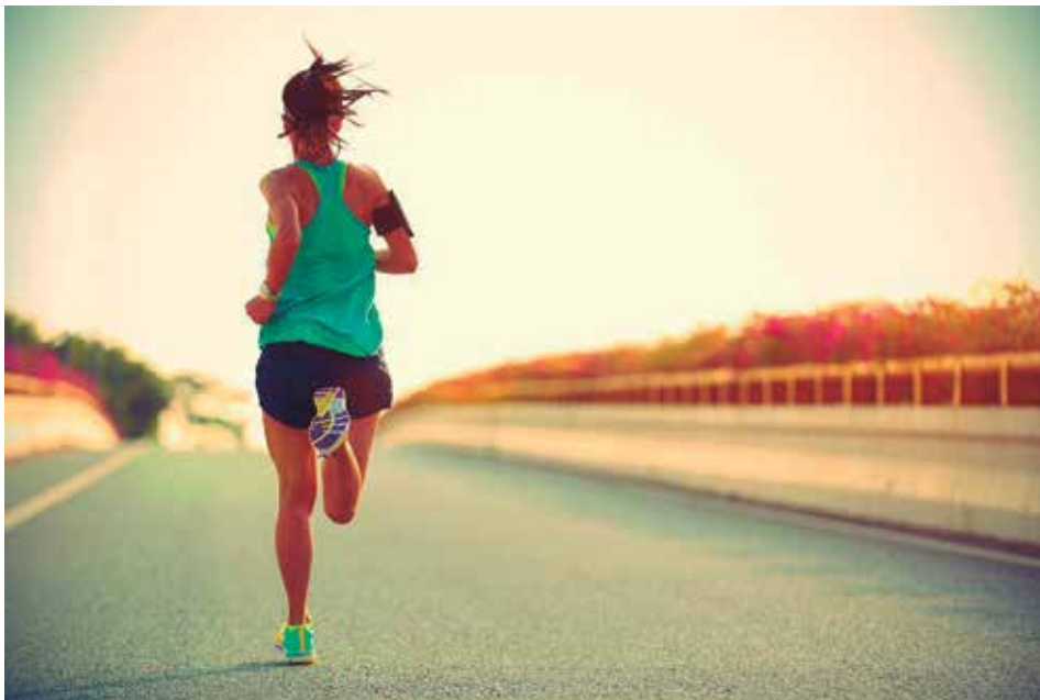
Figura 1: Esporte (corrida) como exemplo de lazer.

Organização Mundial de (ou da) Saúde é uma agência especializada em saúde, fundada em 7 de abril de 1948 e subordinada à Organização das Nações Unidas. Sua sede é em Genebra, na Suíça.