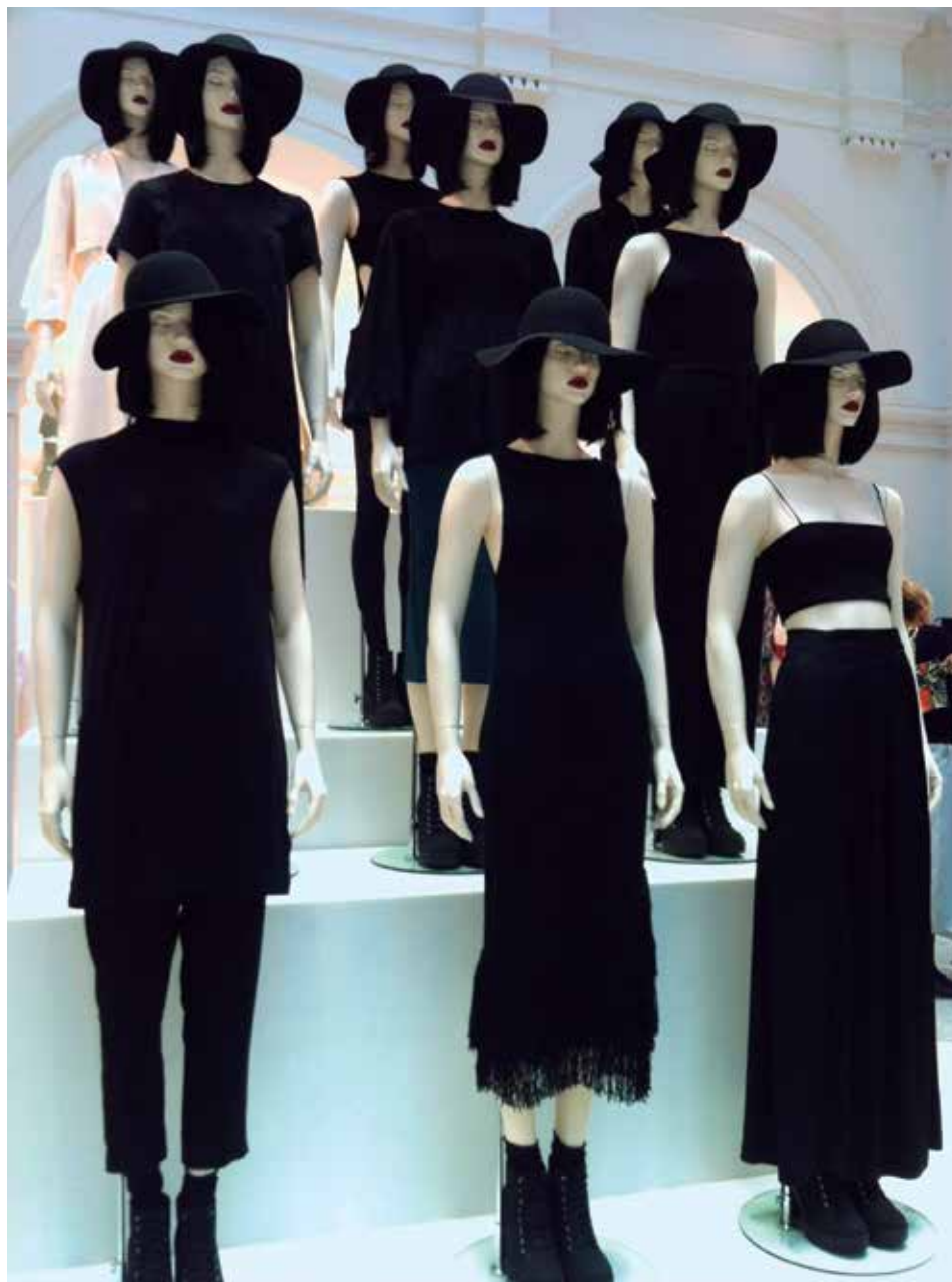
Figura 4: Influência da mídia na constituição dos padrões de corpo "ideal"