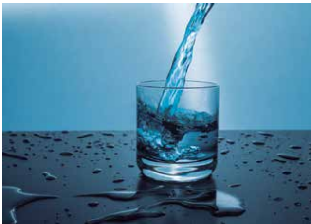
Figura 3: A hidratação é essencial para o nosso organismo. Quanto copos de água você bebeu hoje?

Quando praticamos atividades físicas regularmente, aumentamos a queima dessas gorduras e emagrecemos.