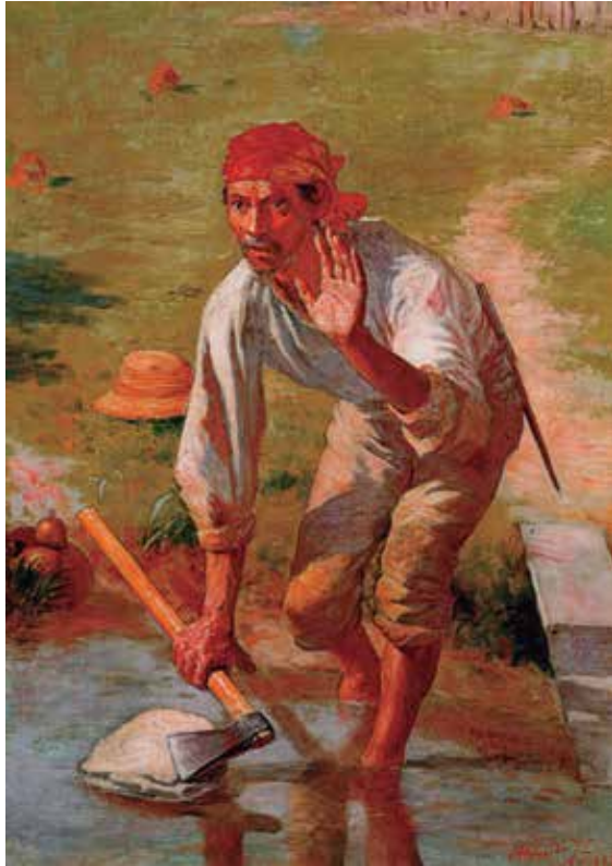
Figura 10.9: Amolação Interrompida, 1983.