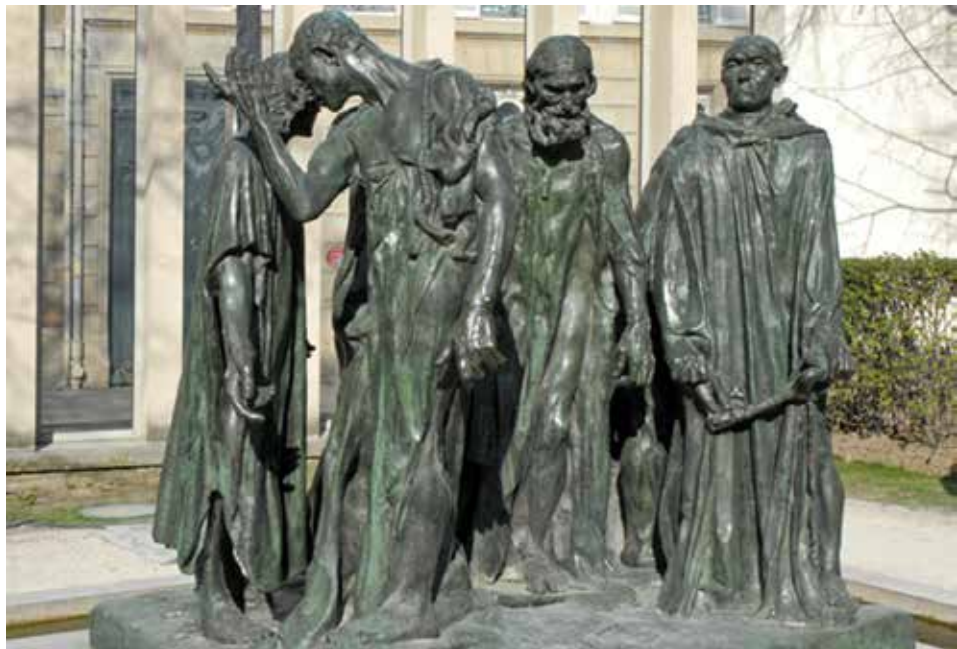
Figura 10.6: Os Burgueses de Calais, 1895.