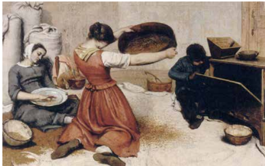
Figura 10.2: Moças peneirando trigo, 1854

Courbet exerceu uma influencia importante sobre Edouard Manet e os impressionistas.