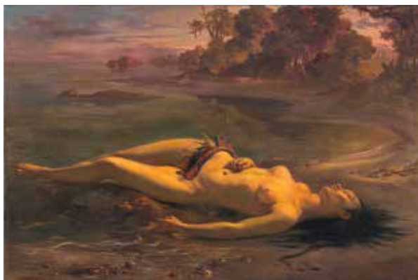
Figura 9.7: VITOR MEIRELES: Moema, 1866

Ao observar as obras desses artistas, percebemos que aqui, no Brasil, as pinturas apresentam características dos estilos Romântico e Neoclássico simultaneamente.