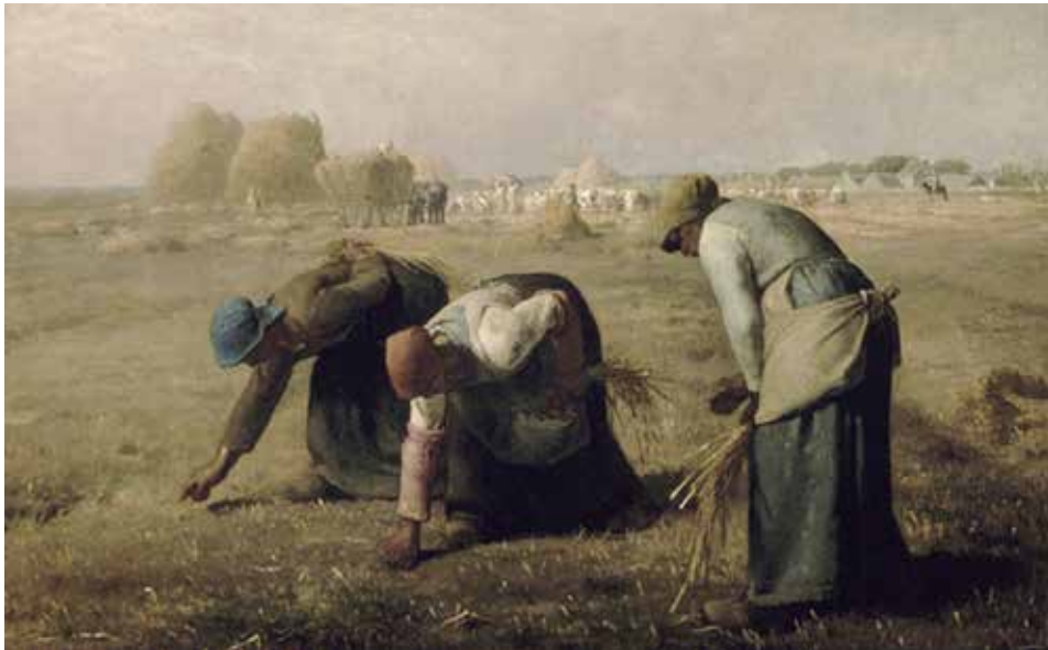
Figura 10.4: As respigadeiras, 1857.

Junto com Courbet, Millet fez parte do Realismo. Sua obra foi uma resposta à estética romântica, e deu forma à realidade que estava à sua volta, sobretudo a das classes trabalhadoras. Os desenhos de Millet eram notáveis por suas formas simples e por sua monumentalidade.