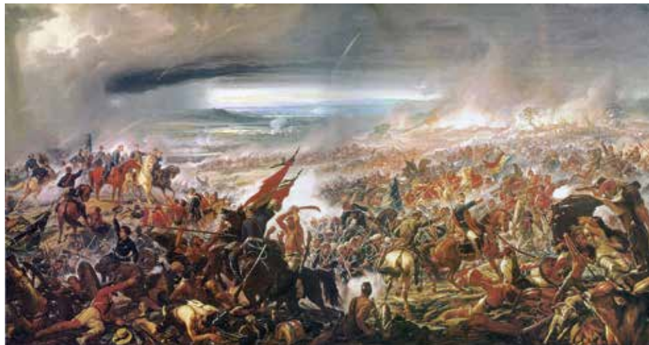
Figura 9.8: PEDRO AMÉRICO: A Batalha de Avaí, 1877