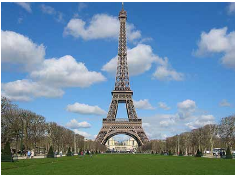
Figura 10.1: Torre Eiffel

Vamos conhecer agora os principais artistas que fizeram parte desse movimento artístico.