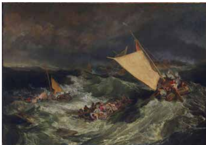
Figura 9.2: William Turner: NAUFRÁGIO, 1805

Turner pinta paisagens com pinceladas fortes, dramáticas, fazendo com que estas despertem diferentes sentimentos na pessoa que está observando. Já Constable busca inspiração nos sentimentos humanos para criar as suas próprias paisagens. Seus quadros são compostos por casas, árvores, nuvens feitas com manchas coloridas, através de pinceladas encorpadas de cores nítidas e brilhantes.