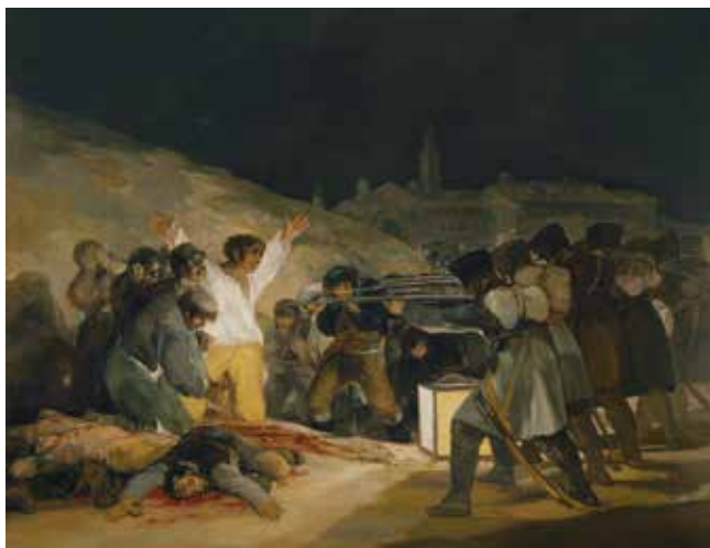
Figura 9.6: Os Fuzilamentos de 3 de maio, 1814.

Sua principal obra foi Os Fuzilamentos de 3 de maio . Esse quadro apresenta o fuzilamento de espanhóis resistentes à ocupação das tropas de Napoleão Bonaparte na Espanha. A cena dramatizada, de 1808, foi pintada numa composição diagonal em 1814. De um lado, os represores, do outro, os reprimidos, evidenciados no interessante jogo de luz e sombra que caracteriza o desejo de liberdade, igualdade e justiça.