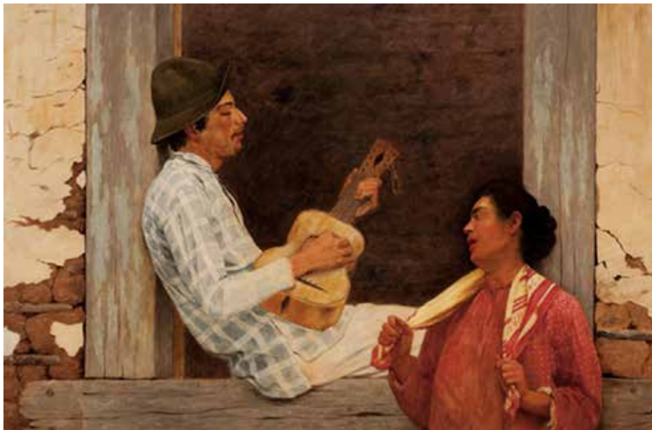
Figura 10.7: O violeiro, 1899.

Podemos observar algumas características do Realismo nas obras do pintor Almeida Júnior, onde representa os tipos e os costumes da vida das pessoas do interior paulista, além das cores e da luminosidade bem características do local.