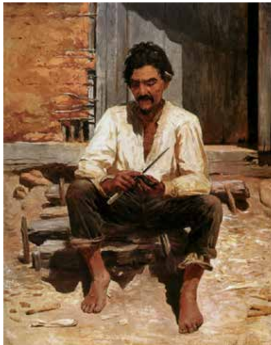
Figura 10.8: Caipira picando fumo, 1983.