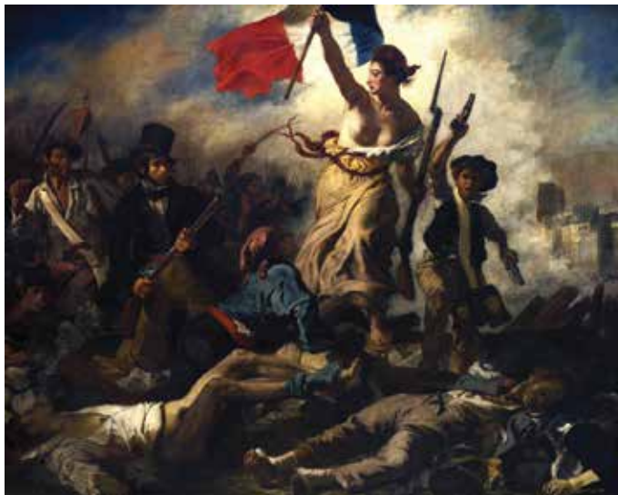
Figura 9.5: A Liberdade guiando o povo, 1830