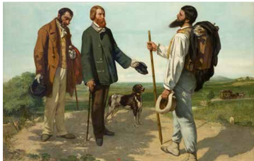
Figura 10.3: Bom dia, senhor Courbet!, 1854