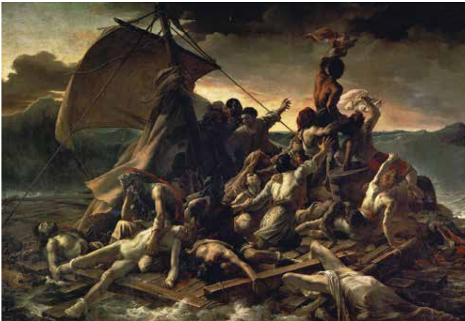
Figura 9.4: A balsa da Medusa, 1819

O pintor Géricault fez parte do grupo de pintores românticos da França. Seus quadros apresentam temas históricos e cenas de batalhas. Théodore Géricault pintou o quadro A Balsa da Medusa . Nele, observamos a luta desesperada pela sobrevivência dos tripulantes da balsa Medusa. Para pintar esse quadro, Gericault fez um estudo profundo sobre essa tragédia, chegando até a entrevistar os sobreviventes do naufrágio.