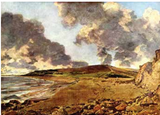
Figura 9.2: William Turner: NAUFRÁGIO, 1805