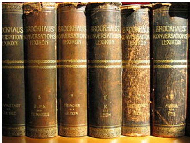
Brockhaus Konversations-Lexikonj, 1902.

Origem: Wikipédia, a enciclopédia livre.