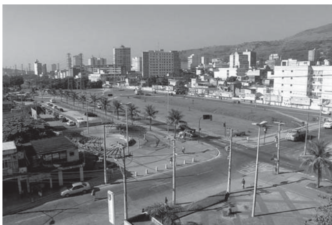
Município de Nova Iguaçu – polo do CEDERJ.