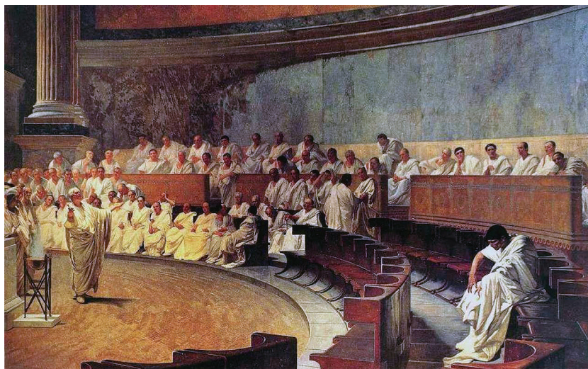
Figura 4.4: Senado, principal instituição romana.