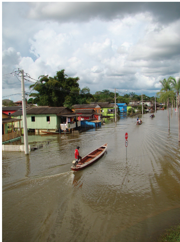
Figura 3.1: Cheia do rio Acre, no norte do Brasil.