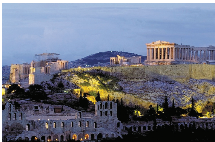
Figura 4.2: Ruínas da Acrópole, parte alta da antiga cidade de Atenas. Devido às guerras e à necessidade de defesa, as cidades eram construídas na parte mais alta de cada território. Nessas áreas urbanas ficavam as casas, praças públicas, oficinas artesanais, mercados e templos. À direita, em destaque, vê-se o Partenon, templo construído em homenagem à deusa Atena.

Cada pólis contava com um governo próprio, leis e força militar, e seus cidadãos tinham voz ativa nas decisões políticas. Outra característica marcante dessa sociedade eram as constantes guerras e a escravidão dos povos conquistados. É importante reforçar que, apesar das diferenças e rivalidades entre as pólis , os gregos (ou helenos , como eles próprios se designavam) tinham uma identidade cultural comum, pois compartilhavam a mesma língua e tradições.