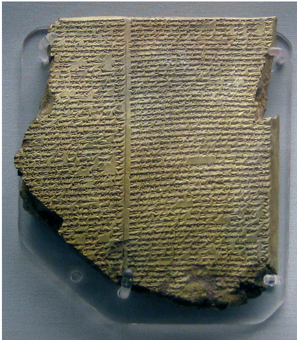
Figura 3.2: Placa de argila com escrita cuneiforme encontrada em Uruk, uma cidade-Estado mesopotâmica.

Fonte: https://en.wikipedia.org/wiki/File:British_Museum_Flood_Tablet.jpg