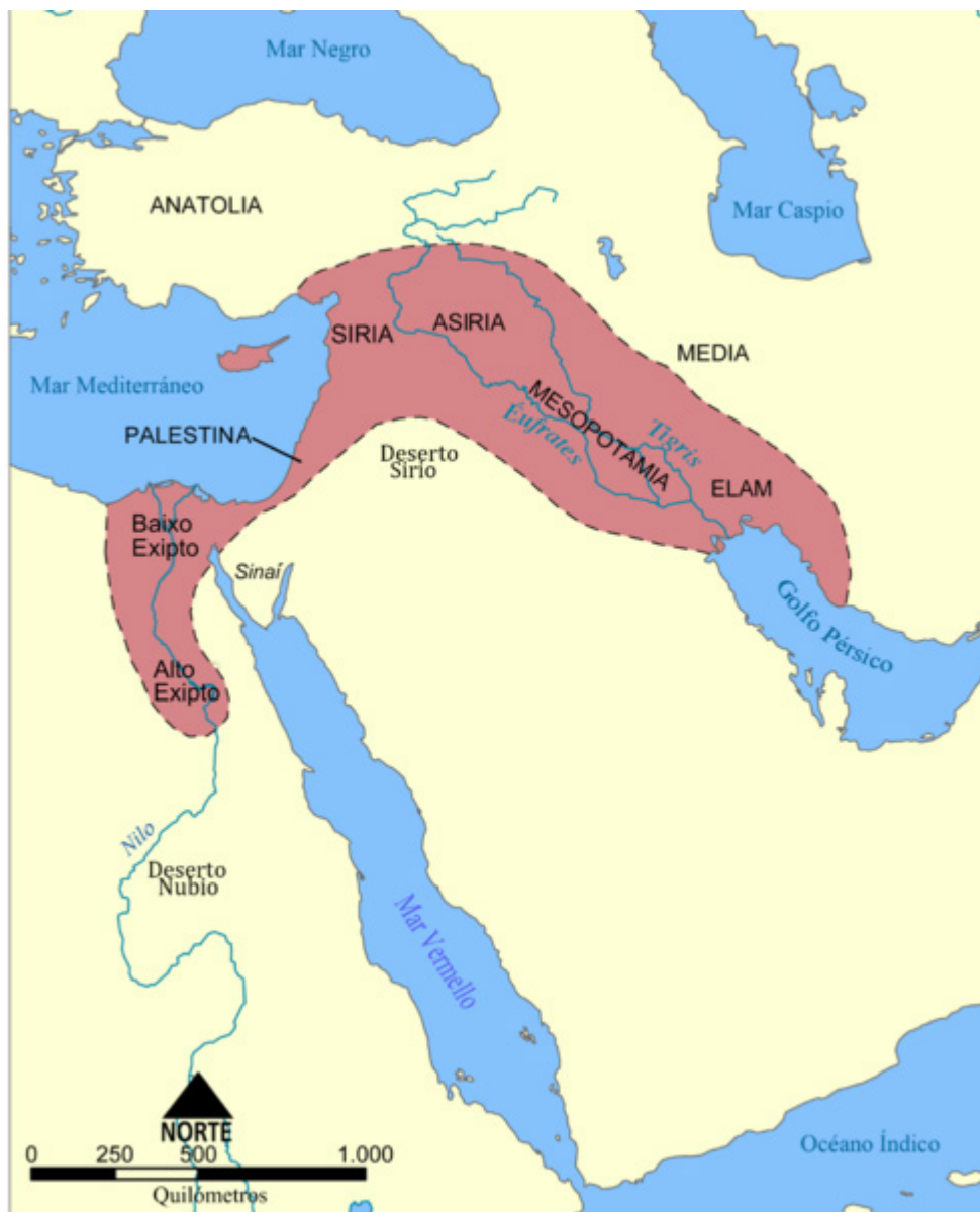
Figura 3.3: Regiões férteis que deram origem à civilização mesopotâmica e egípcia.