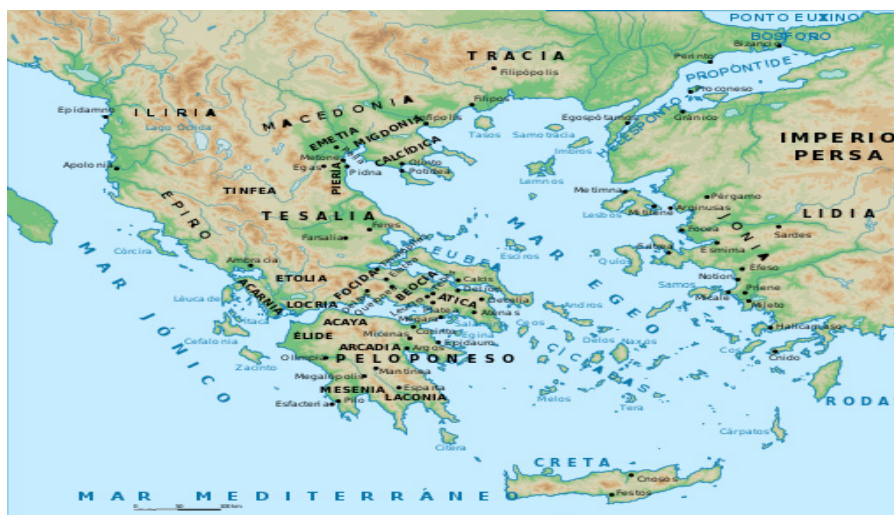
Figura 4.1: As cidades grifadas em verde compunham o mundo grego. Esparta estava localizada na Península do Peloponeso e Atenas, na região da Ática.