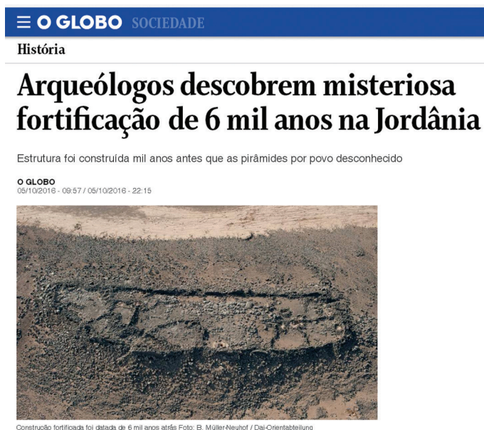
Figura 3.4: Notícia divulgada no dia 6 de outubro de 2016.