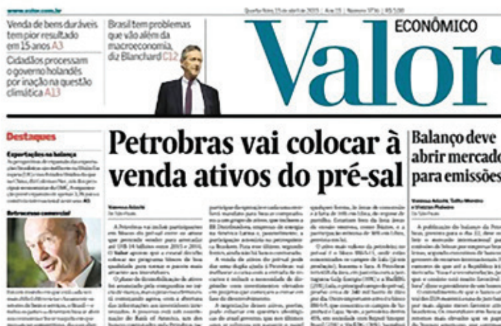
Figura 10.3: Capa de jornal com notícias em destaque (manchetes).

Compare as manchetes da capa do jornal Extra, apresentado acima, com as manchetes da capa do jornal Valor Econômico, a seguir.