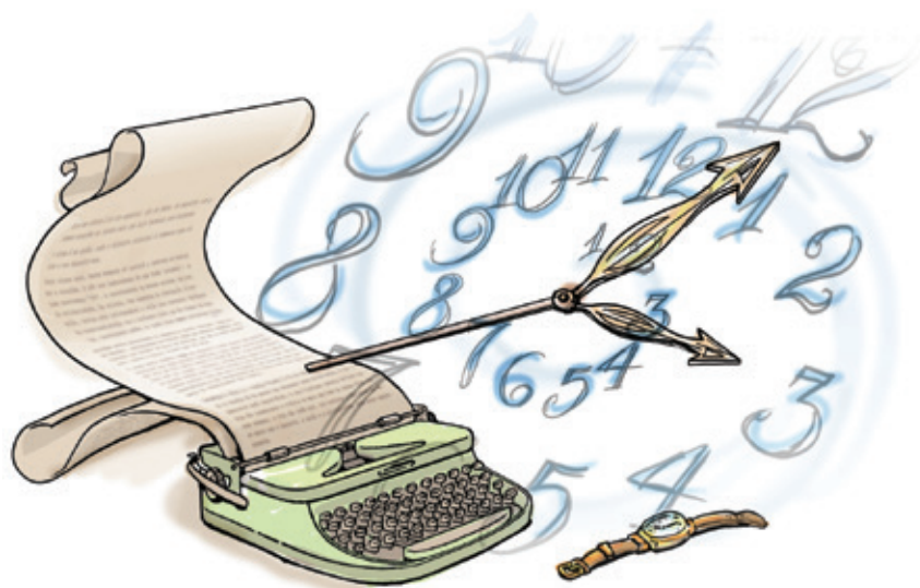
Figura 9.4: O “tempo cronológico” é o tempo medido no relógio e se opõe ao tempo psicológico, que é o tempo do narrador (quando a história é contada à medida que vai sendo lembrada, por exemplo).