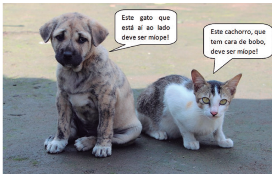
Figura 21.2: Exemplos de orações subordinadas adjetivas: “que está aí ao lado” (cachorro) e “que tem cara de bobo”.