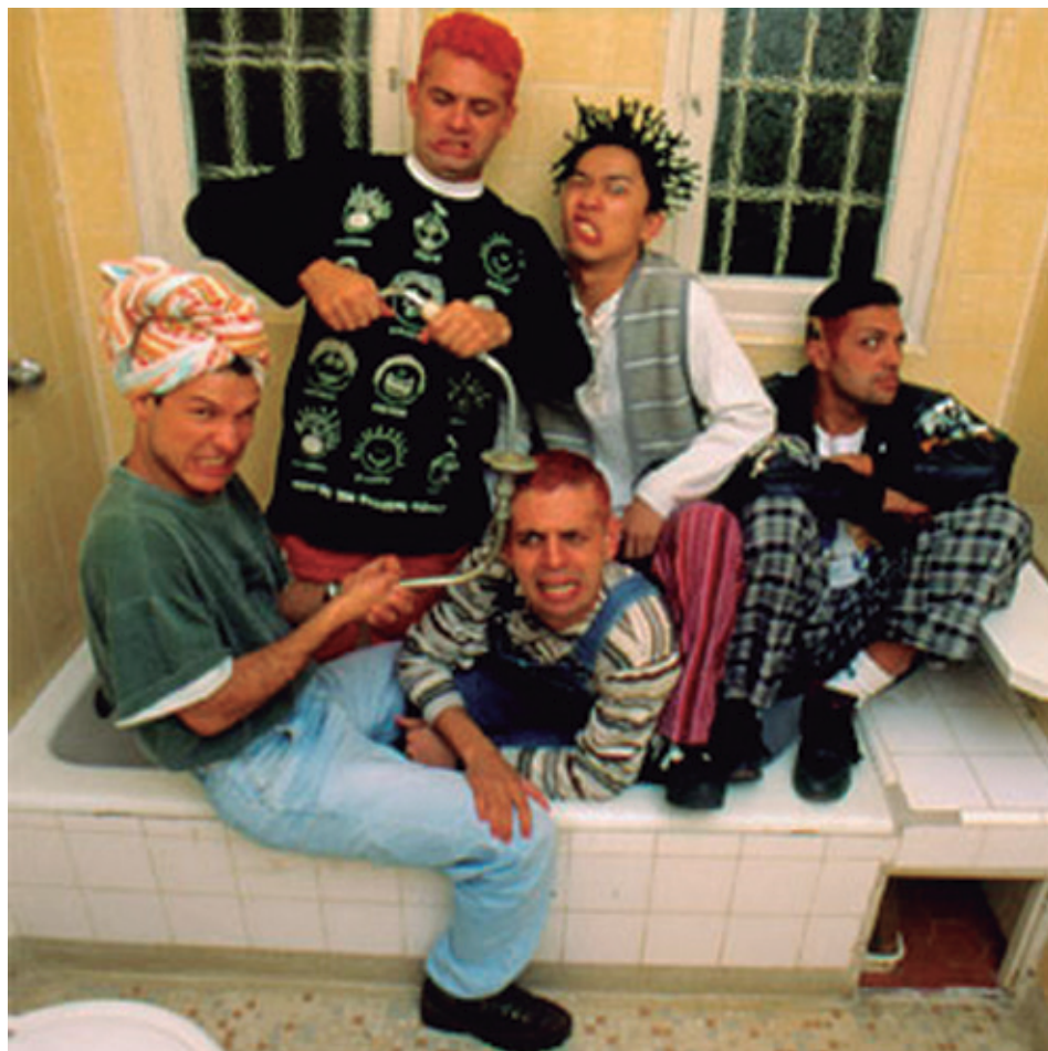
Figura 21.1: Os integrantes da banda Mamonas Assassinas.