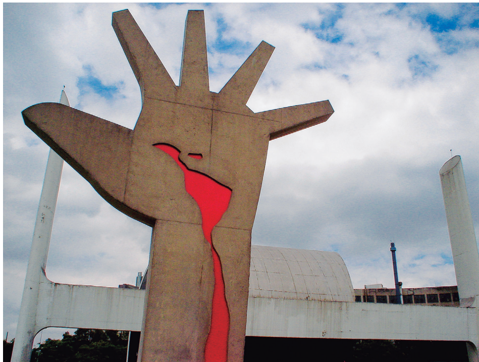
Figura 21.1: Escultura conhecida como Grande Mão.