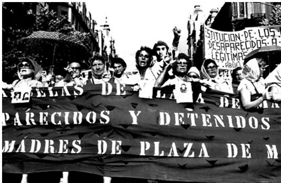
Figura 21.5: Mães na Plaza de Mayo exigindo respostas sobre seus filhos desaparecidos.