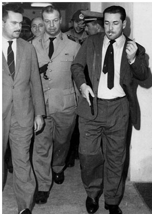
Figura 21.8: Em destaque na foto está Leonel Brizola, que, à época, era governador do Rio Grande Sul. Brizola foi o principal responsável pelo movimento que garantiu a posse de Jango.

Por isso, quando retornou ao Brasil, Jango foi impedido de assumir a presidência no lugar de Jânio e, só depois de muita pressão de um movimento chamado Campanha da Legalidade, conseguiu, finalmente, se tornar presidente.