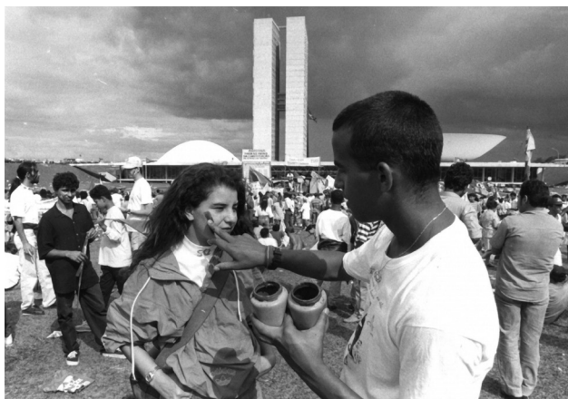
Figura 21.9: Manifestação pelo impeachment de Collor.

Depois de uma campanha cheia de promessas, era a hora de enfrentar o drama da hiperinflação. Para isso foi lançado o Plano Collor, que deu o que falar! Retorno ao cruzeiro, congelamento de preços e salários, já conhecido, e a mais polêmica de todas as medidas: o bloqueio de todas as contas bancárias, cadernetas de poupança e aplicações por 18 meses. Imagine a confusão! Políticos, empresários e a população em geral ficaram indignados, “fomos roubados”, era o que todos pensavam. Somado a isso, Collor adotou uma política de redução de gastos públicos com educação, saúde e incentivo à cultura, além de um processo de privatizações que entregava ao controle privado uma dezena de empresas estatais, tudo em acordo com as orientações do FMI. O país estava sendo entregue às empresas estrangeiras, enquanto, sem ter condições de competir, os industriais brasileiros reduziam a produção, demitiam seus funcionários e muitos decretaram falência. Não tardaram as denúncias de corrupção envolvendo o presidente e pessoas próximas a ele, sua impopularidade chegava a níveis extremos e foi aberto o processo de impeachment em setembro de 1992.