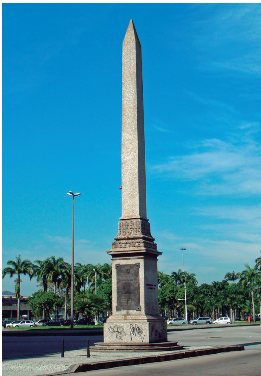
Figura 21.3: Obelisco localizado na Avenida Rio Branco, no centro do Rio de Janeiro. Imagem de janeiro de 2017.