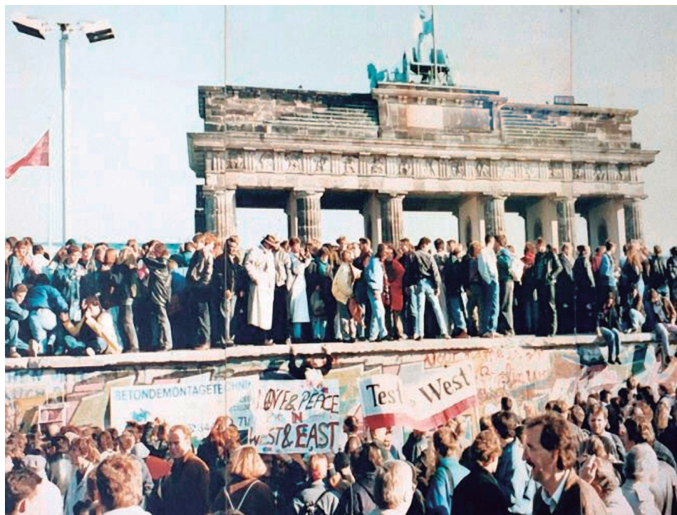
Figura 22.2: A queda do muro de Berlim, em 1989.