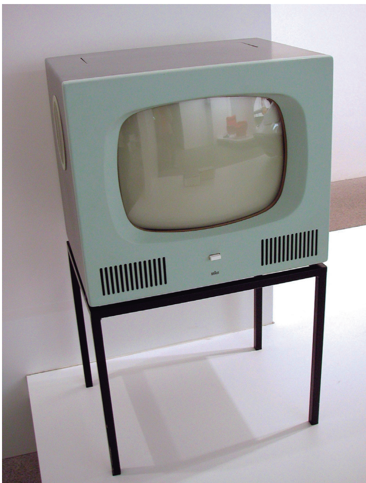
Figura 22.1: A televisão, assim como o rádio e o cinema, foi uma grande formadora e reprodutora da cultura de massa.

Chama-se cultura de massa toda cultura produzida para a população em geral. Ela é veiculada pelos meios de comunicação de massa. Enfim, trata-se de toda manifestação cultural produzida para o conjunto das camadas mais numerosas da população, ou seja, o povo.