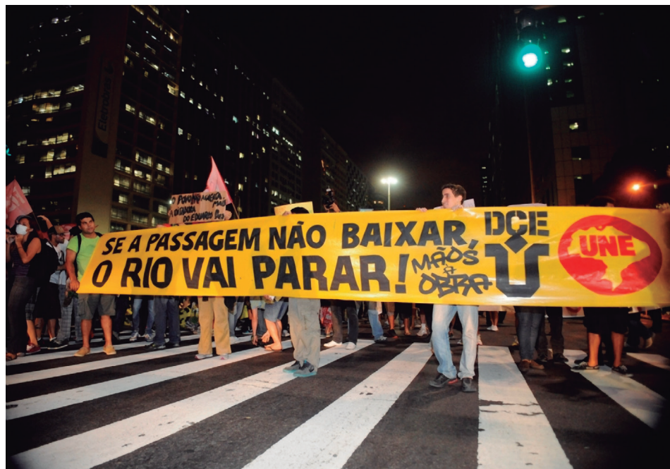
Figura 21.10: Manifestantes exigindo a diminuição das tarifas dos transportes públicos.