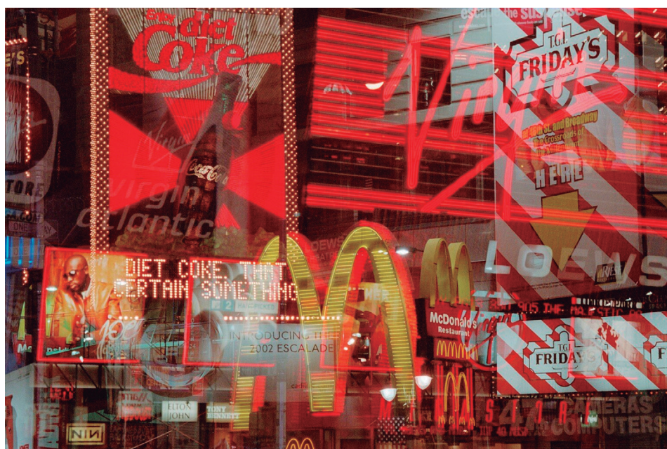
Figura 22.3: Uma das características da globalização é a mundialização de grandes empresas.

Uma das características desses novos tempos é a globalização, que, em síntese, seria mais uma forma de expansão do capitalismo. Permitido, em grande parte, pelos avanços tecnológicos dos setores de comunicação, o processo de globalização acabou se tornando cada vez mais rápido, envolvendo não só o comércio e capitais, mas também telecomunicações, finanças e serviços.