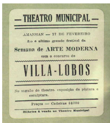
Figura 21.4: Cartaz anunciando o último dia da Semana de Arte Moderna.