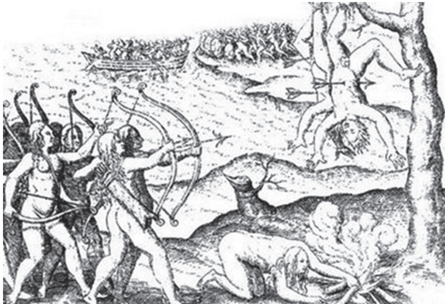
Walter Raleigh, 1601