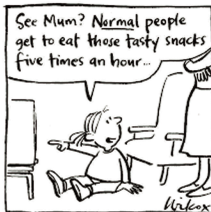
Figura 10.2: A propaganda voltada ao público infantil é danosa.