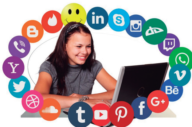
Figura 14.1: Redes sociais, como o Facebook, fazem parte da vida da maioria das pessoas nos dias atuais.

Vamos, então, pesquisar e conhecer novos amigos? O inglês, como língua universal, nos dá oportunidade para comunicação com pessoas de outros países, e isso é muito bom! Vamos começar?