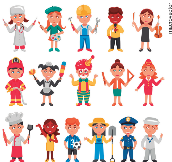
Figura 3.1: Jobs.