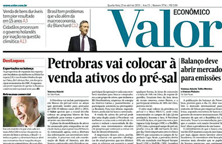
Figura 10.3: Capa de jornal com notícias em destaque (manchetes).

Compare as manchetes da capa do jornal Extra, apresentado acima, com as manchetes da capa do jornal Valor Econômico, a seguir.