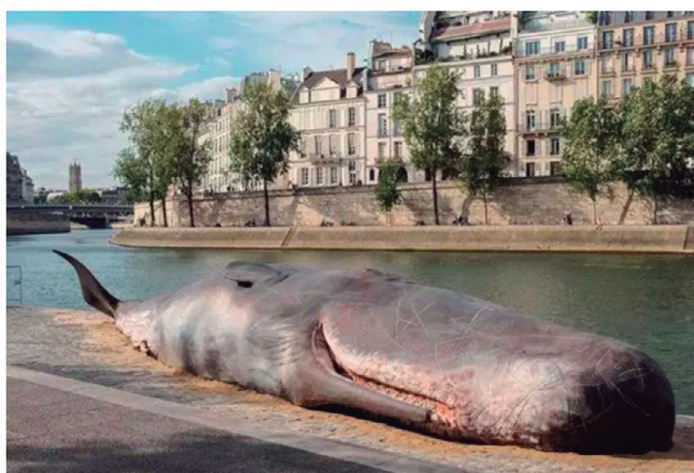
Paris: cientistas forenses foram vistos estudando o fenômeno

Na semana passada, as pessoas em Paris acordaram com uma notícia inusitada: uma baleia encalhada foi encontrada nas margens do Sena, perto de Notre Dame.