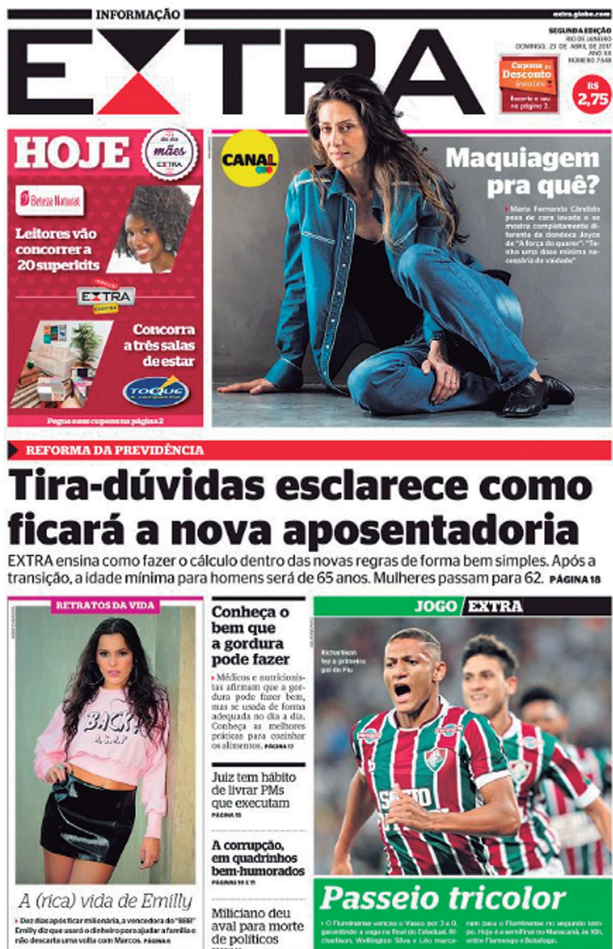
Figura 10.2: Capa de jornal com notícias em destaque (manchete).

As manchetes são utilizadas para chamar a atenção dos leitores em relação a determinadas matérias. Veja como elas estão dispostas no jornal.