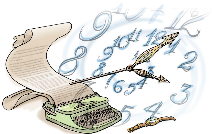
Figura 9.4: O “tempo cronológico” é o tempo medido no relógio e se opõe ao tempo psicológico, que é o tempo do narrador (quando a história é contada à medida que vai sendo lembrada, por exemplo).